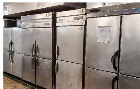
冷蔵庫の温度管理

厨房及び食事提供場所における食品安全への取り組みと、一般衛生管理の運用を行い、食の安全を徹底しています。